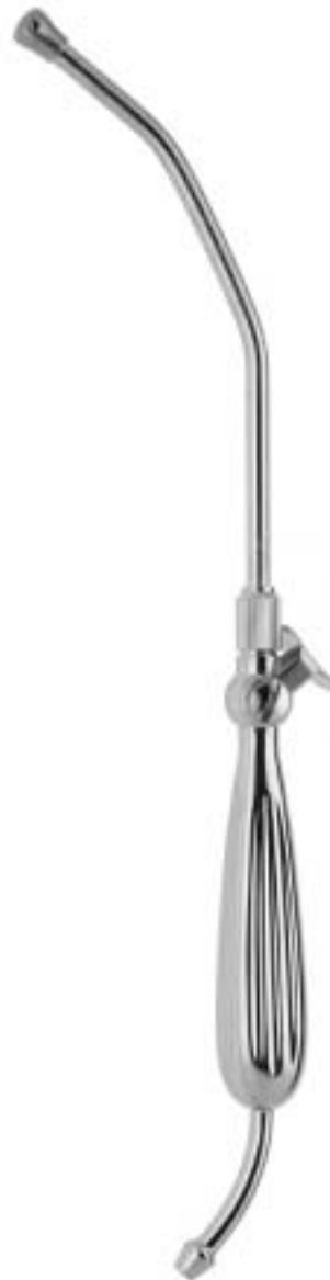
WALTON YANKAUER AE-512-33 ø 10 mm (30 Charr.) 32 cm

mit Absperrventil und abschraubbarem Rohr