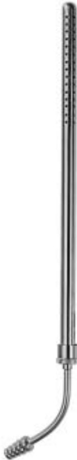
POOLE AE-410-06 ø 6 mm (18 Charr.) AE-410-08 ø 8 mm (23 Charr.)