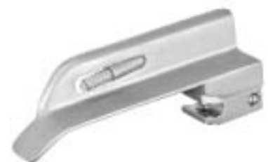
PEDIATRIC Spatel PEDIATRIC Blades