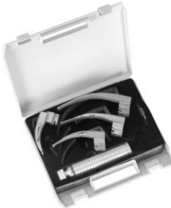
Sigma Lite Faseroptik Spatel Sigma Lite fibreoptic blades