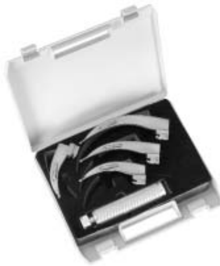
Delta Lite Standard Spatel Sigma Lite conventional blades