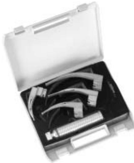
Sigma Lite Faseroptik Spatel mit auswechselbarem Lichtleiter Sigma Lite fibreoptic blades with interchangeable fibreoptic light guide