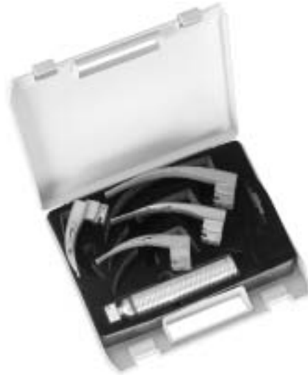
Sigma Lite Faseroptik Spatel mit auswechselbarem Lichtleiter Sigma Lite fibreoptic blades with interchangeable fibreoptic light guide