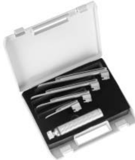
Sigma Lite Faseroptik Spatel mit auswechselbarem Lichtleiter Sigma Lite fibreoptic blades with interchangeable fibreoptic light guide