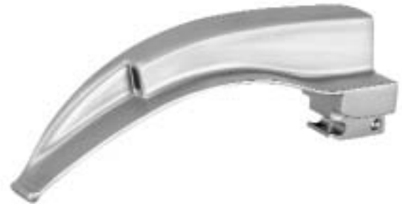
MACINTOSH Spatel mit integriertem Lichtleiteraustritt MACINTOSH Blades with integrated light guide

Sigma Lite Faseroptik Spatel Sigma Lite fibreoptic blades