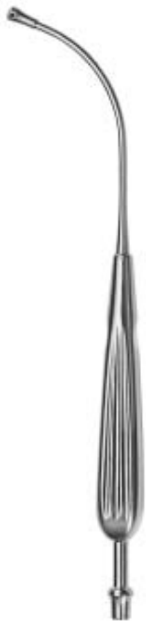
ANDREW-PYNCHON AE-511-24 ø 6 mm (18 Charr.) 23 cm