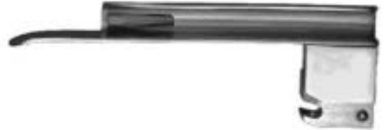
WISCONSIN-HIPPLE Spatel WISCONSIN-HIPPLE Blades