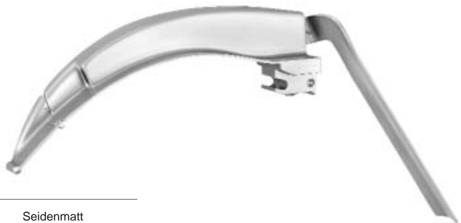
MACINTOSH Spatel mit flexibler Spitze MACINTOSH Blades with flexible tip