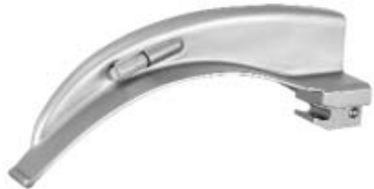
MACINTOSH Spatel mit spezieller Biegung MACINTOSH Blades with special curvature